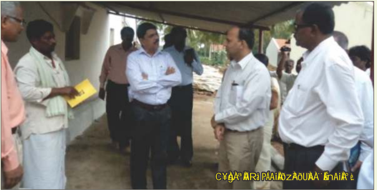
ಮೈಸೂರು ವಿಶ್ವವಿದ್ಯಾನಿಲಯದ ಸಭಾಂಗಣದಲ್ಲಿ.

9. 30 ಡಿಸೆಂಬರ್ 2014 ರಂದು ಮೈಸೂರು ವಿಶ್ವವಿದ್ಯಾನಿಲಯದ ಸಭಾಂಗಣದಲ್ಲಿ 15 ಮೈಸೂರು ವಿಶ್ವವಿದ್ಯಾನಿಲಯದ ವಿದ್ಯಾರ್ಥಿಗಳಿಗೆ ಪದವಿ ಪ್ರಶಸ್ತಿ ಲಗ್ನಿ ನಡೆಯಿತು.