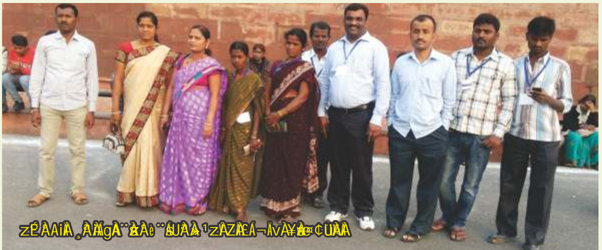
ಮೈಸೂರು ವಿಶ್ವವಿದ್ಯಾನಿಲಯದ ಸಭಾಂಗಣದಲ್ಲಿ.

ಮೈಸೂರು ವಿಶ್ವವಿದ್ಯಾನಿಲಯದ ಸಭಾಂಗಣದಲ್ಲಿ 15 ಮೈಸೂರು ವಿಶ್ವವಿದ್ಯಾನಿಲಯದ ವಿದ್ಯಾರ್ಥಿಗಳಿಗೆ ಪದವಿ ಪ್ರಶಸ್ತಿ ಲಗ್ನಿ ನಡೆಯಿತು.